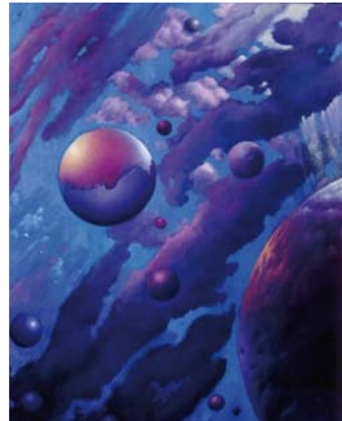
"Esferas moradas" Óleo / tabla: 50 x 40 cm Ref. OS 4