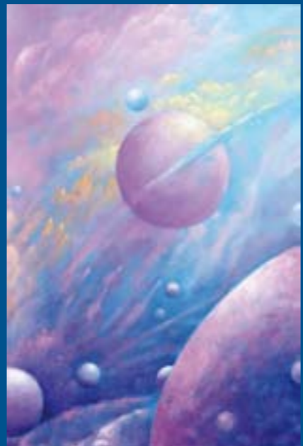
Colección "Esferas celestes" Óleo sobre tabla: 24 x 16 cm Ref. OS 16