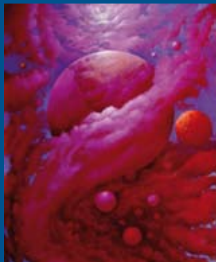
"El nombre del Sol" Óleo / tabla: 54 x 44 cm Ref. OS 2