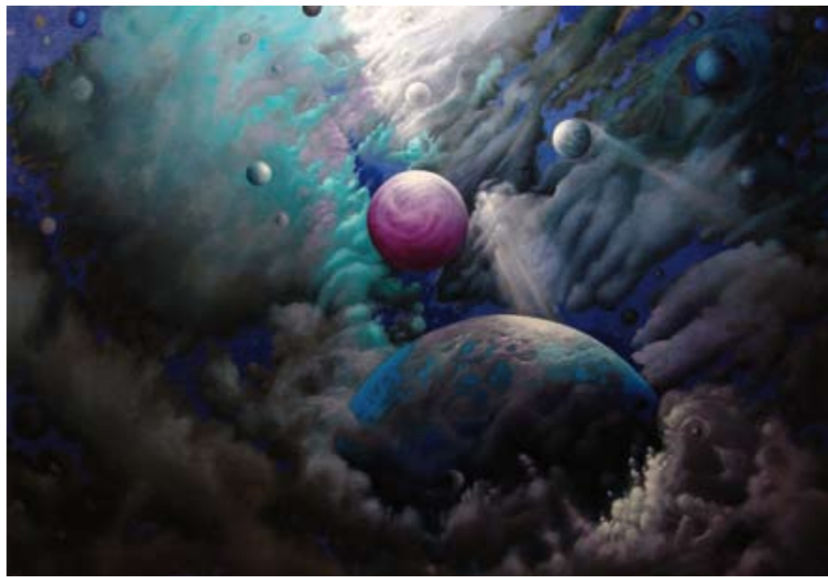
"Cielos de plata" Óleo / tela: 114 x 162 cm Ref. OS 87