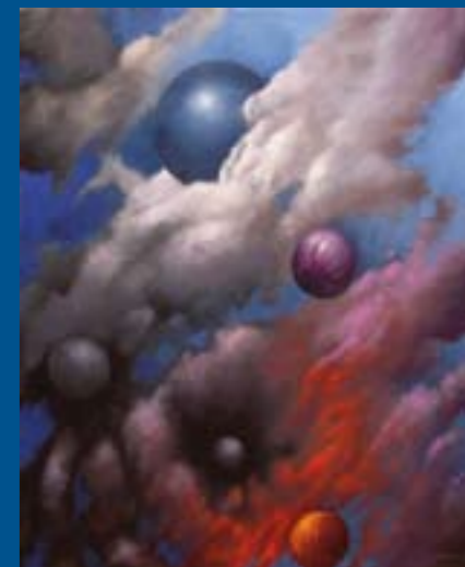
"Humores" Óleo sobre tela: 27 x 22 cm Ref. OS 93