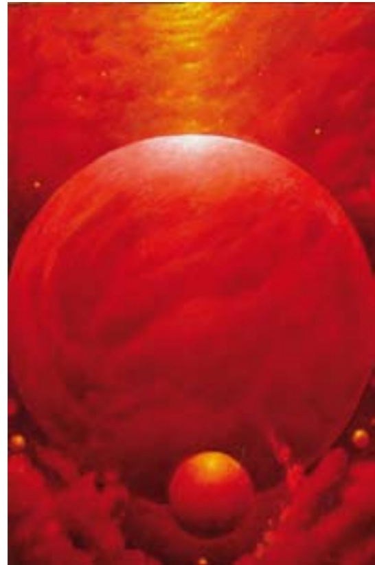
Colección "Esferas celestes" Óleo / tabla: 24 x 16 cm Ref. OS 32