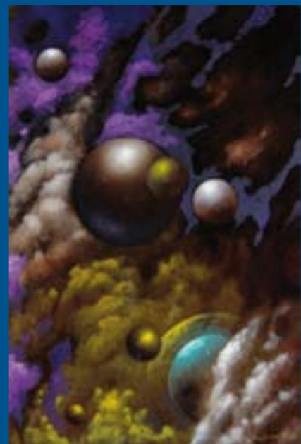
Colección "Esferas celestes" Óleo sobre tabla: 24 x 16 cm Ref. OS 19