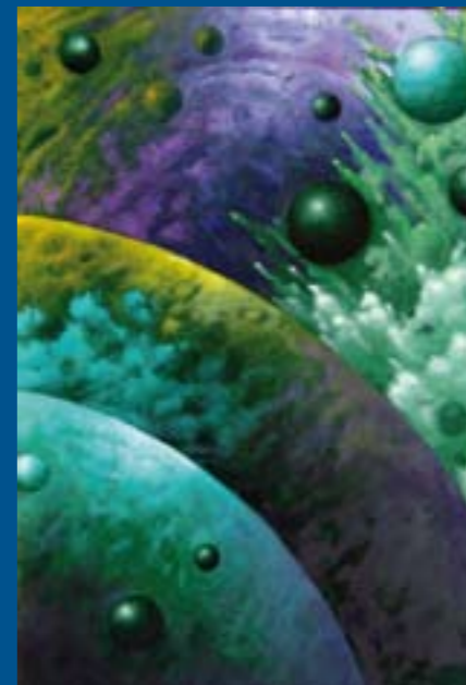
Colección "Esferas celestes" Óleo sobre tabla: 24 x 16 cm Ref. OS 25