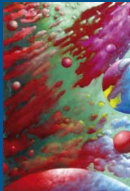
Colección "Esferas celestes" Óleo sobre tabla: 24 x 16 cm Ref. OS 9