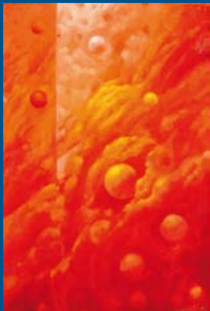
Colección "Esferas celestes" Óleo / tabla: 24 x 16 cm Ref. OS 12