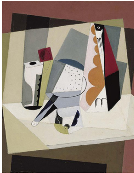
"Nature morte cubiste". Blanchard

En este contexto, y a través de la selección de algunos de los artistas más significativos de la Colección Telefónica, la exposición Intangibles no contará con las obras reales de los autores sino con una propuesta digital diseñada ex profeso para cada una de ellos. El objetivo de la exposición es reflexionar sobre cómo la revolución digital ha impactado en la manera de acercarse al arte, en sus límites físicos y sensoriales, en sus posibilidades casi ubicuas de reproducibilidad, o en